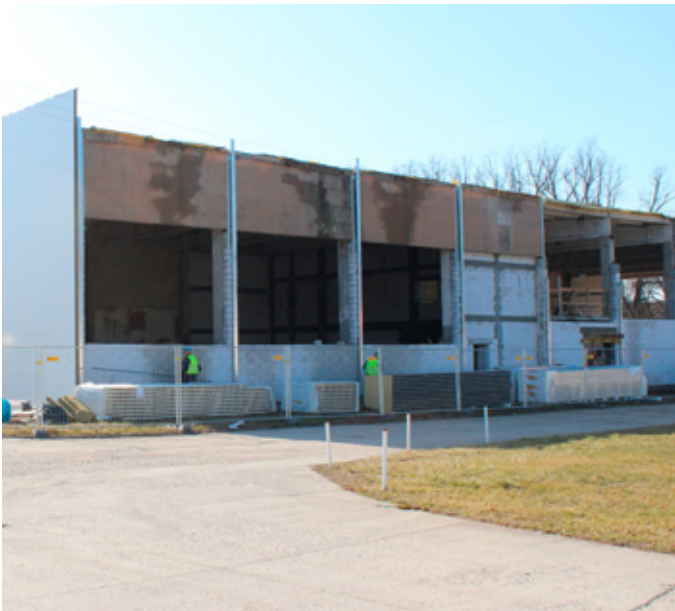
Neubau Plantag Polen

Mit den geplanten Investitionen sollen vor allem die Produktionsbedingungen für moderne Lacksysteme optimiert werden. Nach umfangreichen Investitionen in Lager und Logistik in den letzten Jahren erfordert die Entwicklung neuer moderner Produkte in den Bereichen „Wasserlacksysteme“ und „Strahlenhärtende Systeme“ eine Anpassung der Produktionstechnik, der Abläufe und Kapazitäten. Die Investitionen sind Ausdruck einer nachhaltigen Wachstumsstrategie, zu der auch die Fokussierung auf die Entwicklung umweltfreundlicher und moderner Lacksysteme beiträgt.